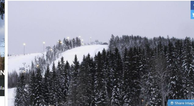
Jämsän Himoksella tapahtui lauantaina onnettomuus, jonka seurauksena rippileirillä ollut 15-vuotias poika kuoli. Julkaistu: 16.2. 23:52

Himoksen lasketteluturma tapahtui kesken rippileirin – Kirkkoherra: ”Kaikki oli käynyt niin nopeasti”