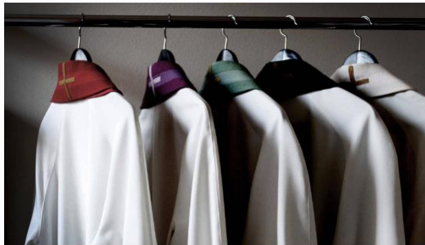
Pastoria epäillään seksuaalisesta häirinnästä.