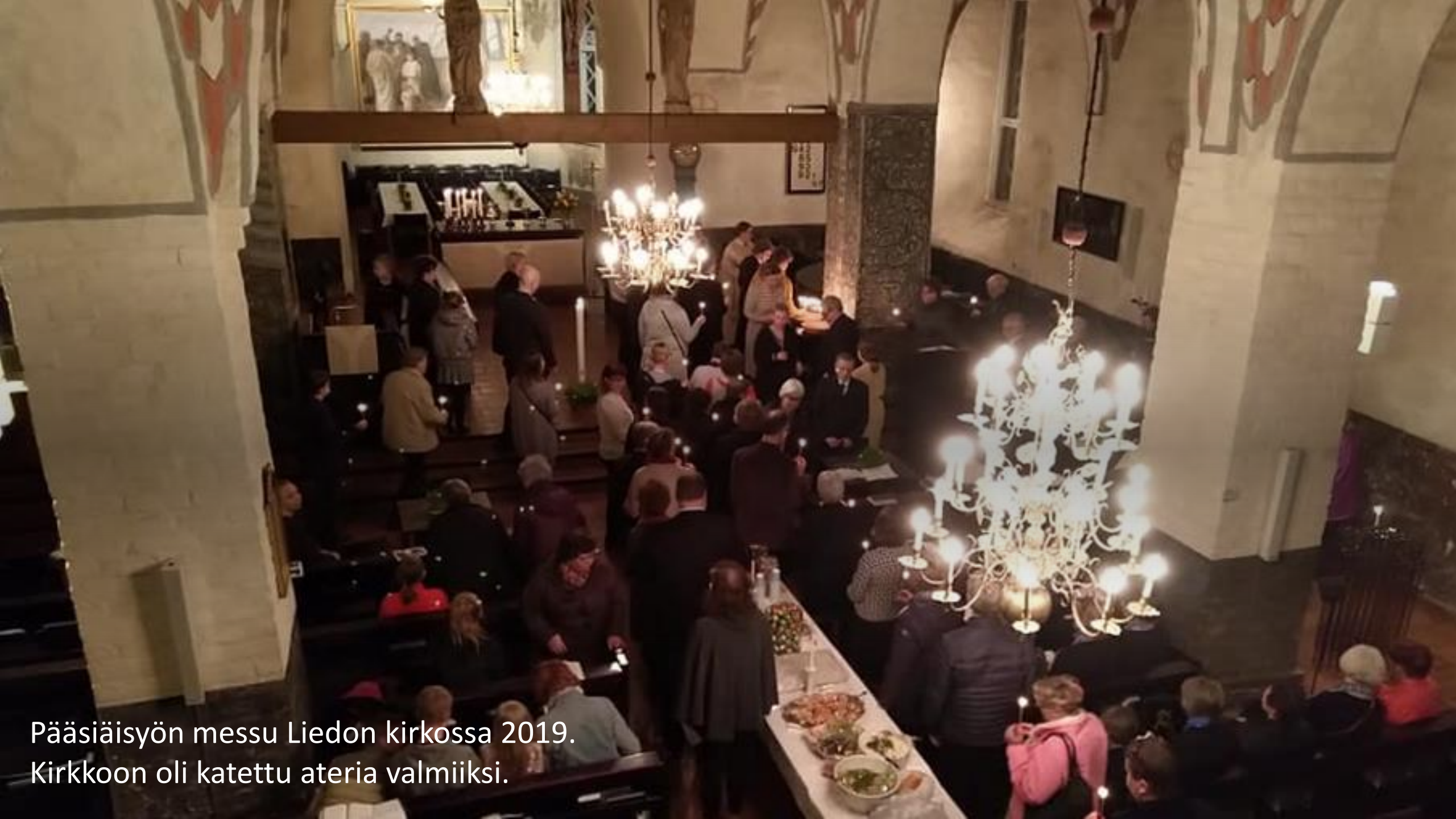
Pääsiäisyön messu Liedon kirkossa 2019. Kirkkoon oli katettu ateria valmiiksi.